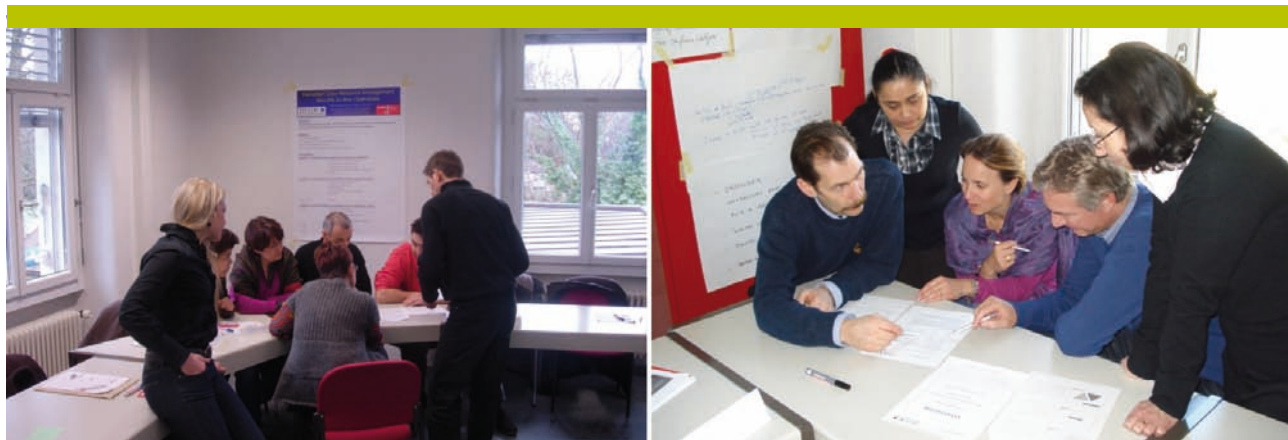
Figure 1. Discussions en groupes lors des journées de formation «crew resource management» Swiss international airlines – Hôpitaux universitaires de Genève

A la fin de cette journée, les participants complètent un questionnaire d'évaluation afin d'analyser leur satisfaction vis-à-vis du cours. Ce questionnaire permet d'évaluer l'organisation générale du cours, son contenu, la qualité de la dynamique de groupe et les méthodes d'enseignement.